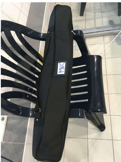
Vlnr: hoes voor spatscherm

De achterlijnen van de drijvende doelen gaan in de grote gele rolcontainers en worden weer netjes teruggezet in de materiaalruimte.